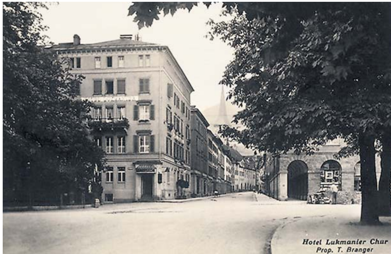
NEL CUORE DELLA CAPITALE Una vecchia cartolina che ritrae l'ormai scomparso Albergo Lucomagno sulla Poststrasse di Coira, luogo di fondazione della Pgi l'11 (o secondo altre fonti il 6) febbraio 1918.

no risolti partendo dal basso verso l'alto o confidare nei buoni frutti del principio di collegialità. Apprezzo il plurilinguismo e quindi mi sento a casa nei Grigioni, dove ciascuna delle lingue presenti vive immersa in una pluralità di idiomi e dove una non trascurabile parte della popolazione conosce e pratica un più o meno accentuato e consapevole plurilinguismo; se guardiamo alla maggioranza, tuttavia, il percorso da fare sulla strada del plurilinguismo è ancora molto. Accanto a questa "identità politica" c'è quella culturale, più incisiva e caratterizzante. Come molti grigionitaliani ho fatto gli studi superiori in scuole tedescofone; li ho maturato la consapevolezza di essere italofofo e ho iniziato ad apprezzare il retaggio culturale della lingua italiana. È l'orgoglio di avere alle spalle un idioma che - contrariamente a quanto successo altrove - non si è sviluppato grazie alla forza unificatrice di un'unità politica, bensì grazie a un seducente richiamo estetico, come lingua letteraria. Una lingua nata oltre mille anni fa, per esprimere parole di lode. Quella, tra le principali lingue romanze, rimasta più vicina al latino. Un linguaggio inscindibile da una cultura d'incredibile bellezza».