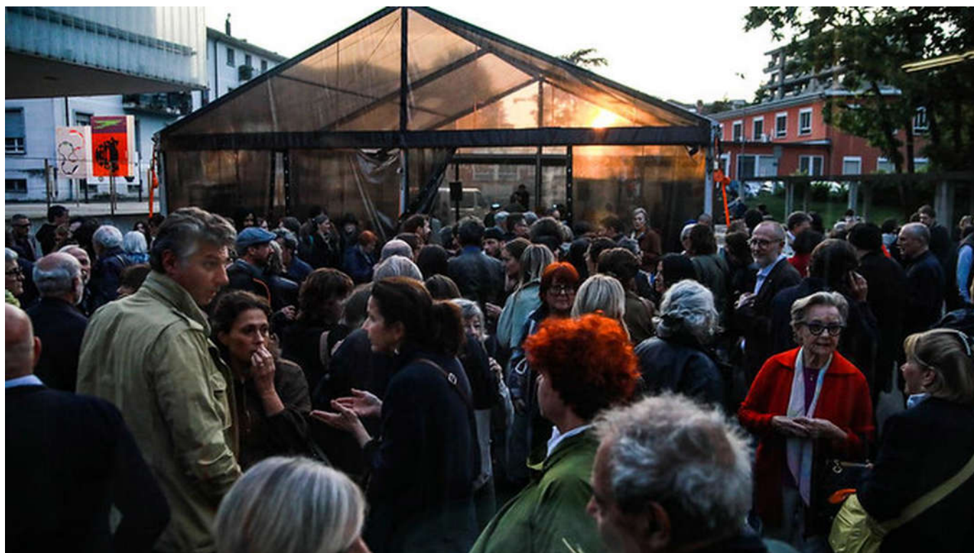
Tra festival affollati e lettura in calo Kappa e Spalla 12.05.2026, 18:15 chiassoletteraria.ch Michele Serra