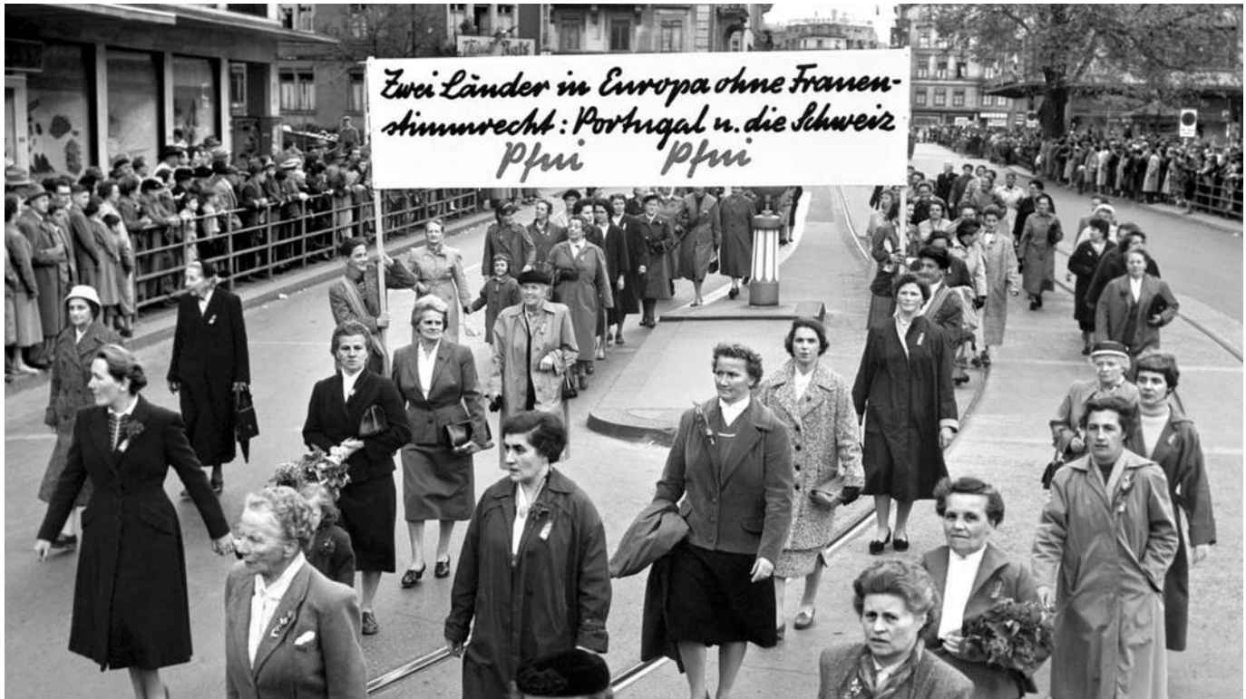
Suffragio femminile, Svizzera