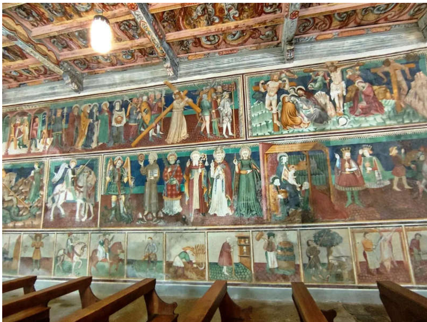
Gli ultimi importanti interventi sugli affreschi risalgono al 1923. Secondo gli studiosi, quei restauri modificarono in parte anche la percezione originale dell'opera.